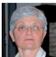
Federica Zanetto Presidente ACP

3 0 anni di sfide. Pediatria al passo con i tempi: il 30° Congresso ACP, svoltosi a Treviso nei giorni 18-19-20 ottobre, ha proposto alcune tematiche emergenti della salute del bambino. Alcuni esempi: i nuovi farmaci “correttori e potenziatori” nella fibrosi cistica e quelli biologici nell’asma grave; la personalizzazione delle cure in oncematologia pediatrica; l’accessibilità delle nuove terapie e la loro sostenibilità in termini di spesa sanitaria e di scelte strategiche nazionali e non solo; le responsabilità dei medici, dei ricercatori e dei sistemi di formazione; il problema della “medicina-spettacolo” e delle grandi speranze che però sono realtà solo per una piccola fetta di pazienti; il tempo dedicato, oggi più che mai indispensabile, per