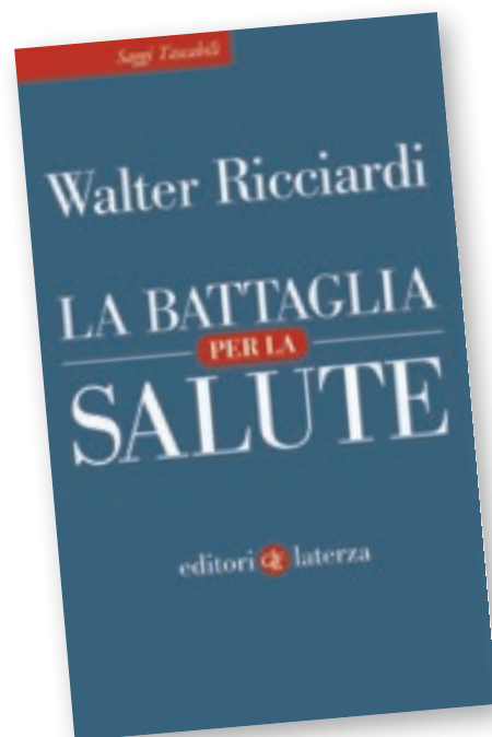
Walter Ricciardi La battaglia per la salute Laterza Editori 2019

Di utilità pratica l’appendice: 12 punti per vincere la battaglia per la salute (per sé e per i propri cari), con una semplice lista di misure da praticare in ambito individuale e familiare per migliorare le proba-