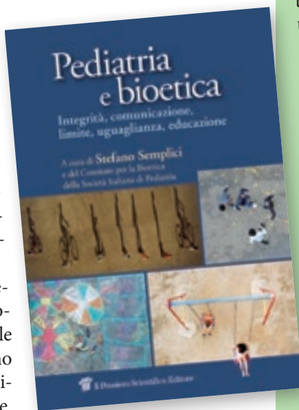
A cura di Stefano Semplici e del Comitato per la Bioetica della Società Italiana di Pediatria Pediatria e bioetica Il Pensiero Scientifico Editore 2019

Sono state individuate, partendo dall'esperienza "sul campo" 5 parole che possono servire per focalizzare i problemi e le responsabilità di chi lavora ogni giorno per il bene dei bambini: integrità, comunicazione, limite, uguaglianza, educazione. Il confronto avviato da bioeticisti e giuristi intorno a ciascuna di esse è un esempio dell'approccio interdisciplinare e aperto indispensabile per individuare le priorità e raggiungere soluzioni condivise.